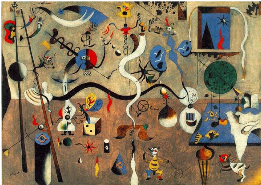
Harlekins karneval av Miro