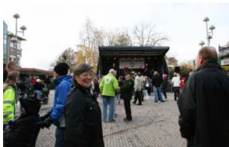
Albatross spelade svängig livejazz. Föreningar höll rent på bl. a. lekplatsen.