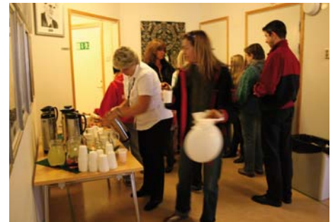
I Kommunalhuset lades sista handen vid öppet-hus-arrangemangen och så snart klockan slog 10 strömmade gästerna till!