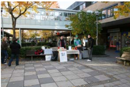
... och strax intill serverades grillkorv ...