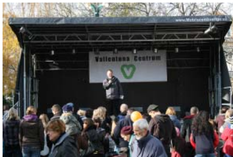
... medan Loogna tjoade "här kommer Pop kidz!"