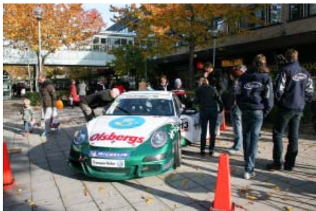
Vid Järnia stod Prins Carl Philips racerbil ...