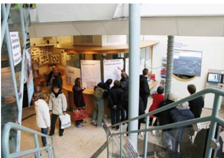
På entréplanet visades kommunens utbyggnadsplaner och hur vi planerar att bygga om "bomkorset". Dessutom erbjöds energirådgivning.