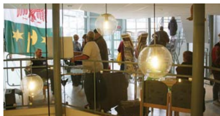
På plan 1 trappa visades bl. a. planer för Vallemtuna IP:s ombyggnad och hur det kulturhuset/biblioteket i parken ska se ut.