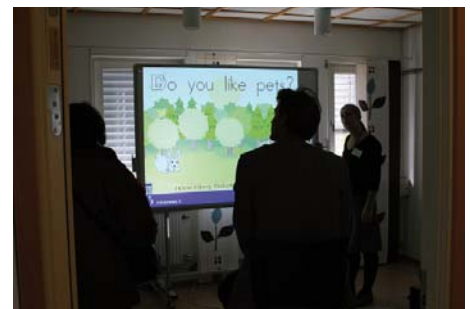
På plan 2 trappor visades dagens läromedel Active-board och Tablet PC. I Bällstarummet ombads besökarna att testa prototypen till kommunens webbplats 2009. Ett 70-tal pers. deltog.