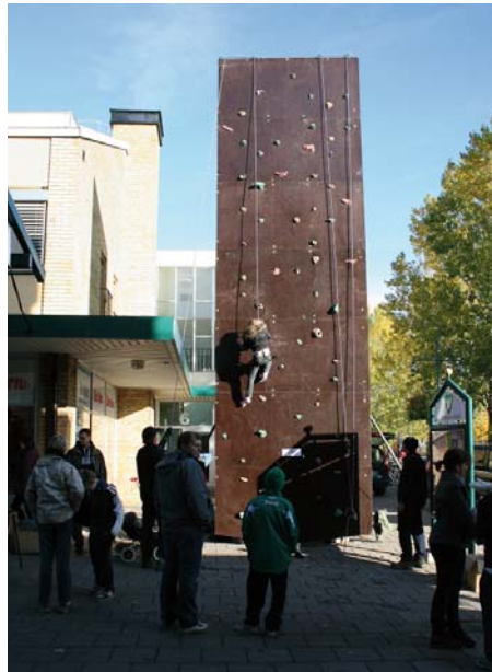
Solen sken, höstfärgerna prunkade och vinden höll sig lugn så att scouterna kunde montera upp sin klättervägg.