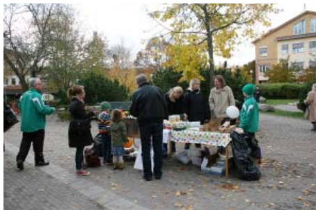
EKO-livs grillade lammspett, elbilen cirkulerade med fripassagerare och det såldes korv och grönsaker på torget.